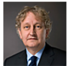
Minister Eberhard van der Laan

In Brussel om de klokken gelijk te zetten ↑